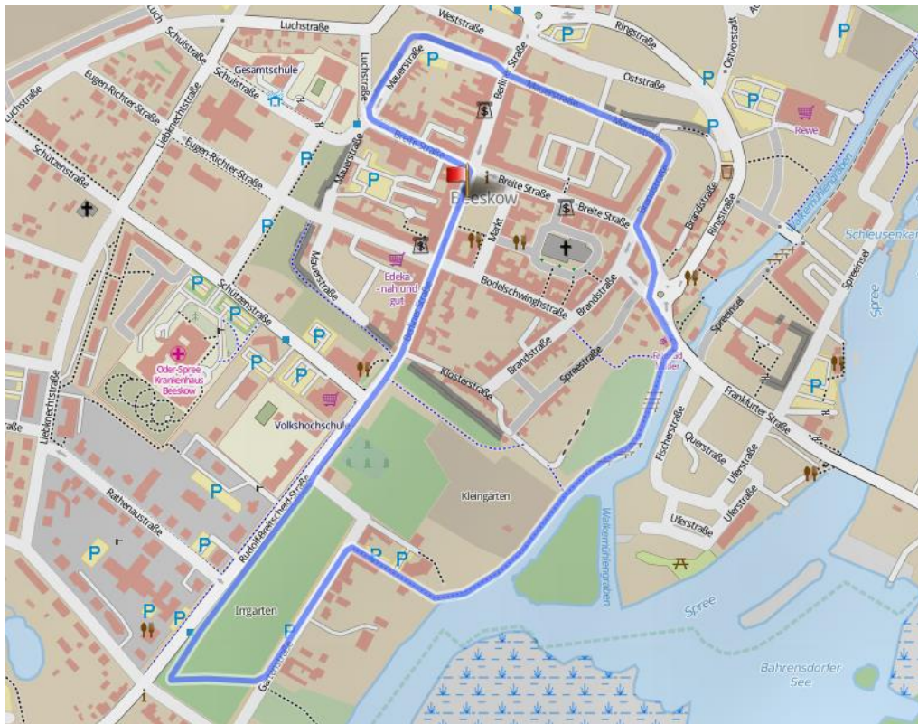
Kartenmaterial von gpsies.com, Leaflet | HikeBikeMap.org Map data OpenStreetMap and contributors, CC-BY-SA Legende, HikeBikeMap.org HillShading + zum Online-Streckenplan auf gpsies.com